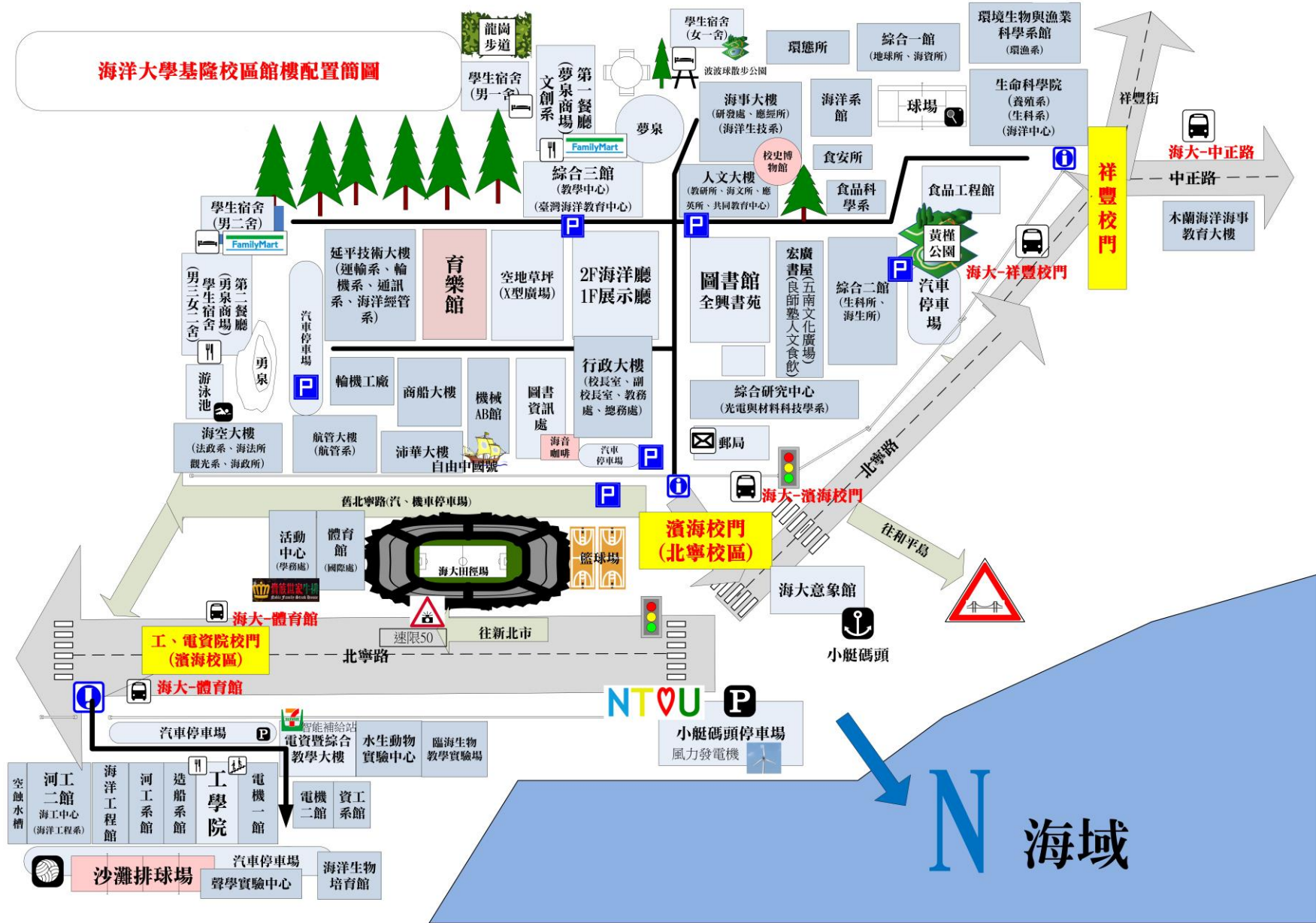
海洋大學基隆校區館樓配置簡圖